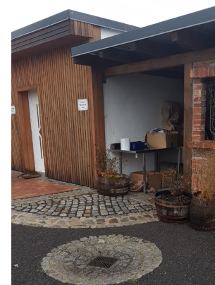
Anbau neben den WCs